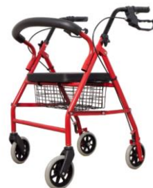
Ходунки шагающие Арт. 9122