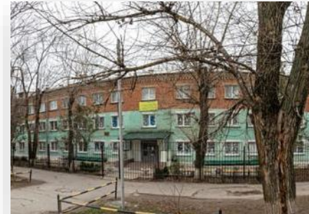
Оснащение кабинета логопеда в ГКОУ РО НОВОЧЕРКАССКАЯ ШКОЛА-ИНТЕРНАТ №1

В рамках проекта нами было поставлено следующее оборудование: Мультисенсорный речевой тренажер, Логопедический тренажер «Дэльфа-142.1», Беспроводный речевой тренажер, Настенный звуковой плакат для обучения алфавитному фонологическому чтению букв и слогов русского языка и коррекции акустической дислексии, Электронное устройство для оперативной записи и воспроизведения звука, Комплект компьютерных программ для развития речевых навыков.