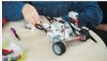
Оборудование для мастерской робототехники