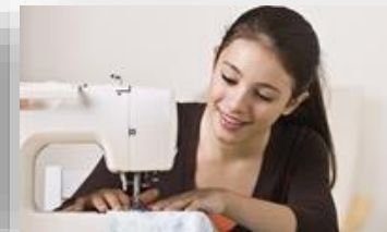
Оборудование для швейной мастерской