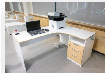
Рабочее место педагога