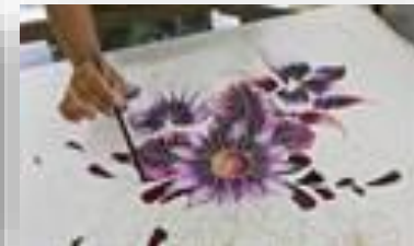
Оборудование для студии росписи по шелку