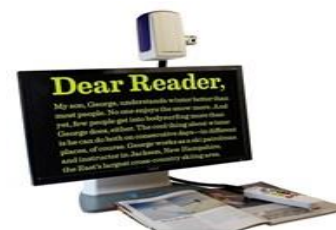
Специализированное оборудование для обучающихся с нарушениями зрения