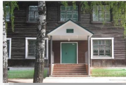
Поставка оборудования для мастерской декоративно- прикладного искусства в ГБОУ «Нартасская школа-интернат»