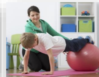
Оборудование для занятий физической культурой, в том числе ЛФК