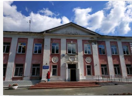
Оснащение кабинетов логопеда и психолога, сенсорной комнаты в ЕКАТЕРИНБУРГСКАЯ ШКОЛА №3 ГБОУ СО