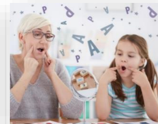
Оборудование для кабинета логопеда- дефектолога