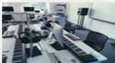
Оборудование для музыкальной студии