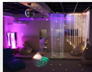
Оборудование для сенсорной комнаты