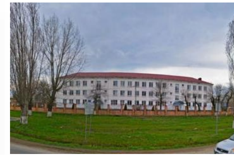
Поставка развивающего оборудования в ГБОУ ШКОЛА-ИНТЕРНАТ № 2 Г. АБИНСКА

-Набор психолога Пертра -Стол учителя -Шкаф многосекционный полуоткрытый -Игровой ландшафтный стол №1 -Стол детский круглый на 6 человек.