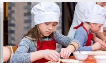
Оборудование для мастерской повара