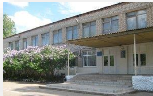
Оснащение кабинетов логопеда и психолога в ЕНОТАЕВСКОЙ ОБЩЕОБРАЗОВАТЕЛЬНОЙ ШКОЛЕ-ИНТЕРНАТ ГКОУ АО