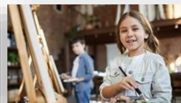
Оборудование для мастерской декоративно- прикладного искусства