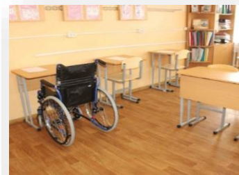
Мебель, в том числе специализированная