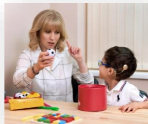
Дидактическое, методическое оборудование для школ