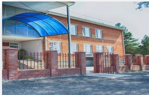
Поставка оборудования для кабинетов психолога и логопеда в ГКОУ КК Школа-Интернат ПГТ Ильского