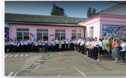
Поставка оборудования для швейной мастерской в ГБОУ «ШКОЛА- ИНТЕРНАТ № 1 СТ. ЕЛИЗАВЕТИНСКОЙ»

В рамках проекта было поставлено следующее оборудование для мастерской ДПИ: штангенциркуль цифровой, защитные очки-экран, набор рашпелей, набор резцов по дереву, стол для ученической швейной машины, пресс ручной универсальный, примерочная, станок для бисероплетения, станок для вышивания, набор инструментов для работы с кожей, кроме этого были поставлены: установка гидропонная и стол производственный.