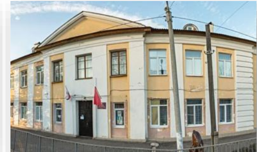
Поставка оборудования для мастерской агропромышленного профиля в МБОУ ООШ № 42

В рамках проекта по оснащению кабинета логопеда нами был поставлен комплект оборудования, состоящий из: - Логопедическое зеркало Dstrana, - Программно-дидактический комплекс, - Методика профилактики и коррекции четырех видов дисграфии «Море Словесности», - Семиуровневый конструктор-коммуникатор с рамками.