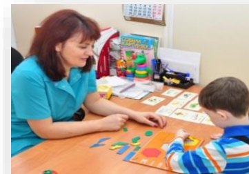
Оборудование для кабинета психолога