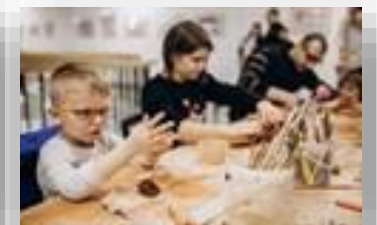
Оборудование для студии лепки