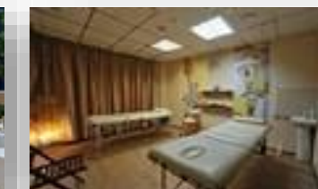
Оборудование для кабинета массажного дела