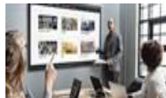
Зона для проведения он-лайн мероприятий