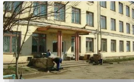
Поставка оборудования для швейной мастерской в «Школу-интернат №1»