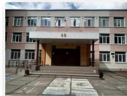
Оснащение гончарной мастерской в ШКОЛЕ №49 МБОУ

Учреждению было предложено профессиональное оборудование: Профессиональный стол логопеда, Профессиональный стол психолога-дефектолога D-strana pro, Постановочные зонды 7 шт., Стерилизатор термический для логопедического инструмента, Логопедический тренажер Дэльфа-142.1 версия 1.4, Методика профилактики и коррекции дисграфии «Море Словесности», Комплект 1 методических пособий по развитию речи, мебель, Игровая логопедическая мозаика и другое.