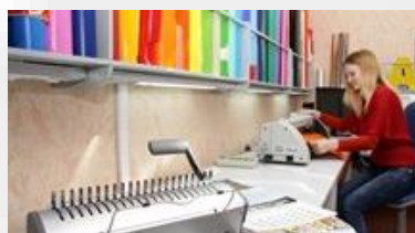
Оборудование для картонно-переплетной мастерской / полиграфической мастерской