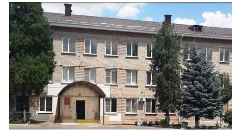
Оснащение мастерской повара в Государственном Общеобразовательном учреждении «Могочинская Специальная Школа-Интернат»