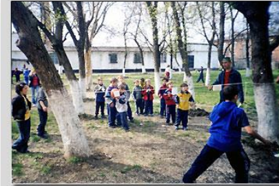
Оснащение гончарной мастерской в ГКОУ «Школа-интернат для детей с ОВЗ, детей-сирот и детей, оставшихся без попечения родителей»

Для поднятия на новый уровень оздоровительных программ и методик, актуальных для всех категорий учащихся, в том числе и для детей с ОВЗ учреждению было предложено интерактивное профессиональное оборудование: -Интерактивный логопедический комплекс -Интерактивный стол логопеда -Стол психолога-дефектолога мультимедийный -Интерактивный развивающий комплекс -Сундучок логопеда.