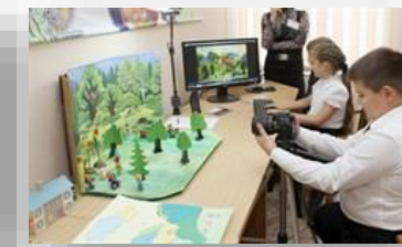
Оборудование для студии анимации