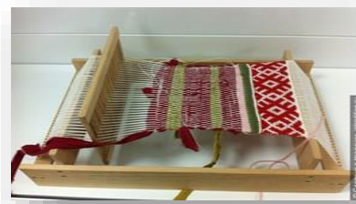
Оборудование для ткацкой студии