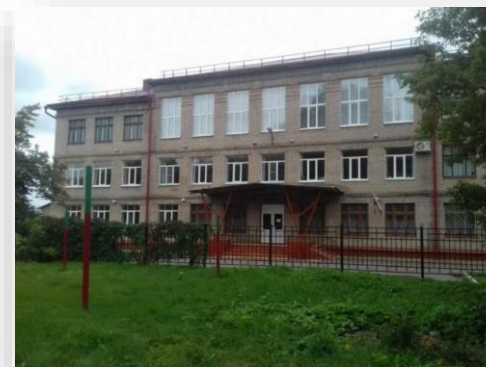
Поставка оборудования для кабинета логопеда в МАОУ СОШ № 24

В рамках проекта по оснащению школы детским развивающим оборудованием нами было поставлено: Комплект балансировочный "Успех" (Баламетрикс), Игровой набор "Дары Фребеля", Коврик для занятия на балансире, Ограничители для ног на балансировочную доску, Набор методических материалов "Сенсорные пластины", Домино "Последовательность действий", Проориентационная система ПРОФИ-II (Локальная версия).