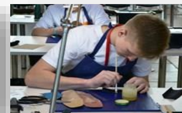
Оборудование для мастерской обувного дела