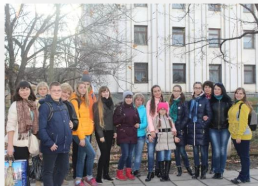
Поставка развивающего оборудования для ССШИ №1 ГБОУ РК