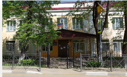
Поставка Аппаратно-программного комплекса для ЕРМОЛИНСКАЯ ШКОЛА-ИНТЕРНАТ ГКОУКО