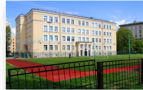
Поставка развивающего оборудования для ГБОУ Школа №480 Кировского Района Санкт-Петербурга

Чтобы создать условия для самореализации ребенка с ОВЗ в творчестве, а именно обучить школьников основным приемам и навыкам работы с глиной было предложено следующее оборудование: Гончарные круги, Печь электрическая с вертикальной загрузкой, Шкаф сушильный, Муфельная печь. Теперь воспитанники имеют возможность проявить талант, фантазию, творческие умения.