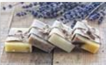
Оборудование для студии мыловарения