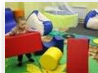
Оборудование для внеурочной деятельности/зоны отдыха