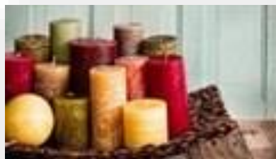
Оборудование для студии изготовления свечей