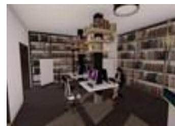
Зона автоматизированных рабочих мест посетителей