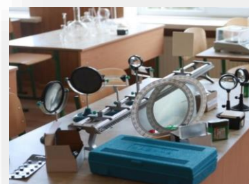
Оборудование для кабинета физики