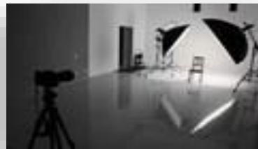
Оборудование для фото/видео мастерской