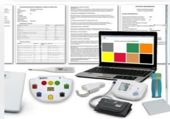
Аппаратно-программный комплекс оценки здоровья учащихся