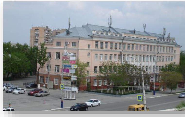
Оснащение кабинетов логопеда и психолога, сенсорной комнаты, мастерских для МИНОБРНАУКИ АСТРАХАНСКОЙ ОБЛАСТИ