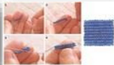
Оборудование для студии бисероплетения