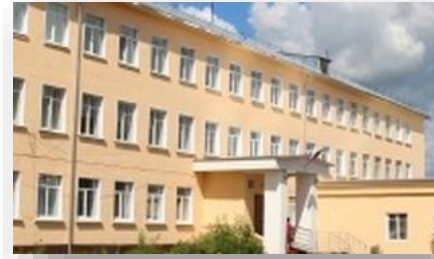
Поставка оборудования для строительной мастерской в «Нерехтскую Школа-Интернат для Детей с ОВЗ»

В рамках проекта нами было поставлено оборудование для сенсорной комнаты (панно «Бесконечность» и «Звездное небо», модуль «Сухой дождь», светящийся набор для слабовидящих детей, многофункциональный стол «творчество», фиброоптическое панно «Веселый свет», комплект мягких пуфов, матов и кресел, установка для ароматерапии и лампа-вулкан); оборудование для развивающих занятий (тактильная змейка, балансировочная доска, дидактические панели «Времена года» и «Тандем», методики профилактики и коррекции дисграфии, «ЛогоБлиц Школа», логопедические зеркала и др.).