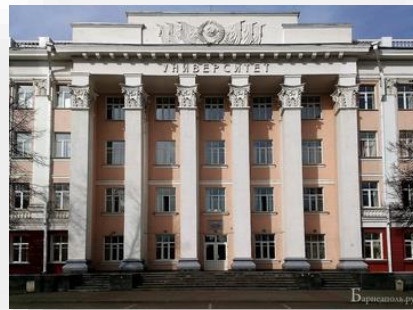
Поставка оборудования для кабинета логопеда в МИНОБРНАУКИ АЛТАЙСКОГО КРАЯ