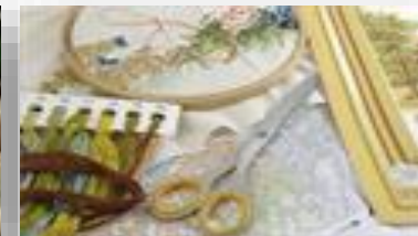
Оборудование для студии вышивания