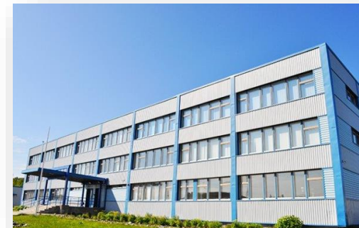
Поставка оборудования для кабинетов психолога и логопеда в Минькинскую коррекционную школу-интернат Мурманская обл, с.Минькино

В рамках проекта для задач психолого-педагогической деятельности было поставлено следующее оборудование: интерактивная панель Антошка 32 дюйма, Многофункциональный набор психолога 8 модулей, программное обеспечение Логомер 2 (в том числе USB-версия), сундучок логопеда, сундучок психолога-дефектолога.