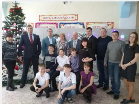
Поставка оборудования для кабинета логопеда в СПЕЦИАЛЬНУЮ (КОРРЕКЦИОННУЮ) ШКОЛУ-ИНТЕРНАТ № 1 Г. АНГАРСКА ГОКУ