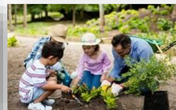
Мастерская агропромышленного профиля/сити-фермерства