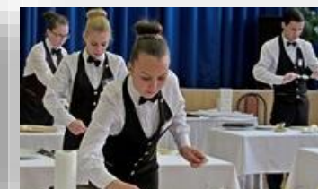
Мастерская "Персонал сферы обслуживания"