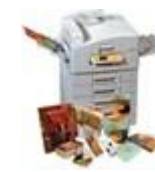
Зона для печати на плоском шрифте