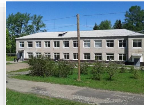
Оснащение экологической студии в СКШИ VIII ВИДА МКОУ

В рамках проекта по оснащению школы детским развивающим оборудованием нами было поставлено: Коврик 10 мм, Тактильная дорожка (7 составных модулей), Стенка гимнастическая деревянная Тип 1, Ковер из матов с цветным наполнителем-гелем (в комплекте 6 шт.), Муляж артикуляционного аппарата, Стенка гимнастическая деревянная Тип 2, Мат складной, цветной 2000*1000*100мм / 2 секции, Игровой набор «Монтессори 14 в 1».