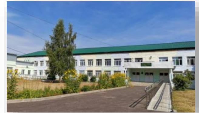
Оборудование мастерской агропромышленного профиля в ГБУ СОИ РМ "Потьминском психоневрологическом интернате с детским отделением"