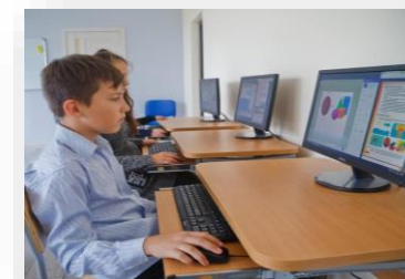
Компьютерное и мультимедийное оборудование (кабинет информатики)