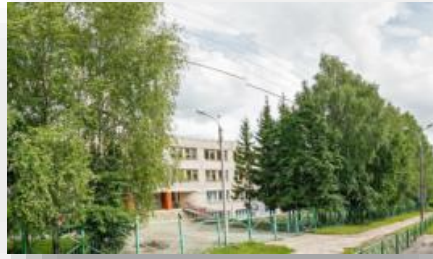
Оснащение комнаты психологической разгрузки в БОУ «Чебоксарская общеобразовательная школа для обучающихся с ОВЗ №1»