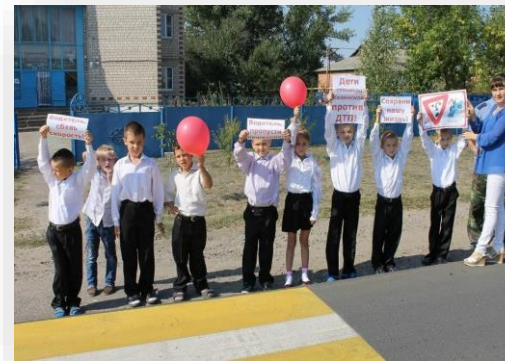
Поставка развивающего оборудования ГКОУ РО КАЗАНСКАЯ ШКОЛА-ИНТЕРНАТ

Для оборудования кабинета логопеда нами было поставлено: Интерактивная светозвуковая панель Космос, Зеркало для индивидуальной работы, 15x22 см Логопедический тренажер Дэльфа-142.1 версия 1.7., Комплект Супер Баланс с балансировочной дорожкой "Нейротрек", Ковер «Орбита», Логопедическое обследование детей. Диагностика. (Методика В.М. Акименко), Кресло-мешок для сенсорной комнаты (Размер XL).