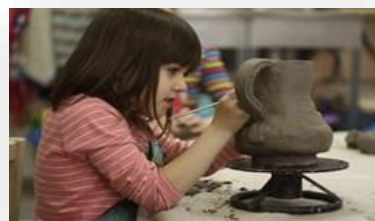
Оборудование для гончарной мастерской