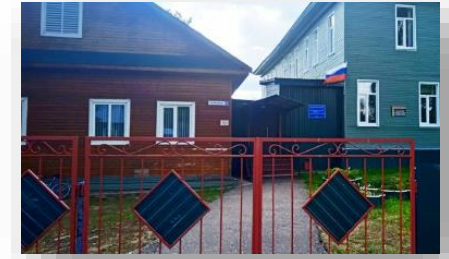
Поставка оборудования для полиграфической мастерской на 10 учеников в ГКОУ «Вохомской школе-интернат»

В рамках проекта было поставлено следующее оборудование для дооснащения столярной мастерской: штангенциркуль, цифровой пассатижи, резцы по дереву, стамески, коврик электрический, тиски слесарные, стол производственный, различные кисти, шпатель, верстак комбинированный.