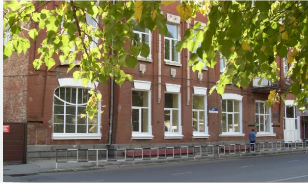
Оснащение кабинетов логопеда-дефектолога и психолога диагностическим и коррекционным оборудованием в ГБОУ «Школе №21 г. Краснодара»