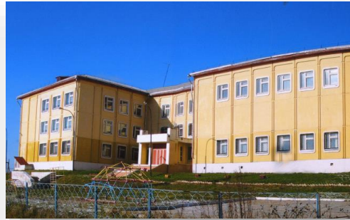
Оснащение кабинетов логопеда и психолога в ГКОУ «Кувшиновская Школа-Интернат»