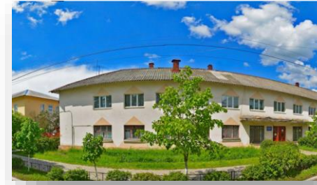
Дооснащение кабинетов логопеда и психолога диагностическим и коррекционным оборудованием в «Адаптированную школу-интернат № 10»

В рамках проекта нами было поставлено: станки, прессы, растяжки, комплект инструментов и обувная швейная машинка. Всё оборудование соответствует необходимым требованиям и нормам безопасности и подходит для обучения всех категорий учащихся, включая детей с ОВЗ. Под руководством опытного педагога учащиеся школы-интерната освоят навыки профессии "Обувное дело" и смогут на практических занятиях применять полученные знания: ремонтировать обувь, делать набойки, растягивать колодку и голенище по форме ног и т. д.