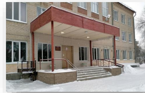
Поставка оборудования для кабинета психолога и кабинета домоводства ГБОУ Областной центр диагностики и консультирования

Чтобы обучить школьников основным приемам и навыкам работы с глиной было предложено следующее оборудование: Полка для обжига в печах, Стойка для обжига, Гончарный круг, Табурет для гончара, Стол для занятий, Столик в печную, Подиум для хранения глины двухъярусный, Стеллаж широкий, 6 полок, Печь для обжига керамики, Гипсовые формы, различные виды глины, наборы инструментов и многое другое.