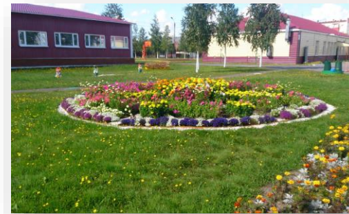
Оснащение кабинета психолога в КОУ «Нефтеюганская школа-интернат для обучающихся с ограниченными возможностями здоровья»

-Интерактивный комплекс D-strana Зв1, 32.