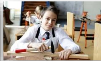
Оборудование для мастерской строительного профиля