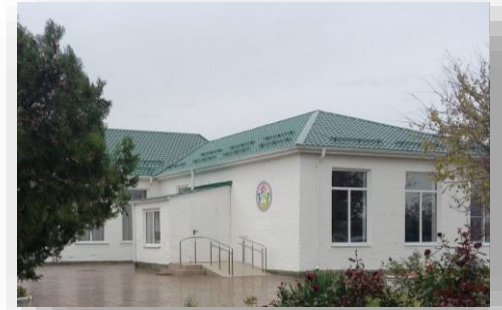
Оснащение развивающим оборудованием ГБОУ ШКОЛА- ИНТЕРНАТ № 7 СТ-ЦЫ КАЗАНСКОЙ

-Альбом "Формы". Развивающие пособия на липучках, Игровой многофункциональный стол «Творчество», Игровой набор "Дары Фребеля», Игровой набор «Монтессори 14 в 1», Интерактивная панель DS1 (Тонкая) 65», Интерактивный комплекс D-strana 3в1, 32" Качели-скорлупа арт. ИА28495, Манекен женский, Набор методических пособий "Тактильное домино«, Набор психолога Пертра, Профессиональный стол логопеда D-strana Logo PRO, Развивающее пособие "Чтение«, Развивающий кубик, Стол-мозаика, Письменная и печатная буква Монтессори, Развивающая панель Счеты напольные, Цифры и чипсы Монтессори, Интерактивная доска+проектор+стойка+кабель, Шумовой набор.