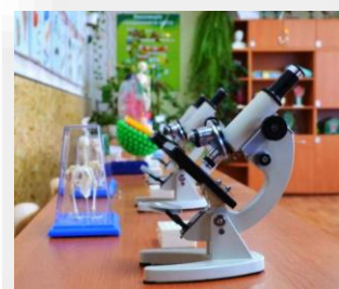
Оборудование для кабинета биологии