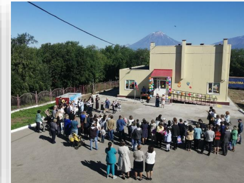
Поставка обучающих материалов в КАМЧАТСКУЮ ШКОЛУ-ИНТЕРНАТ ДЛЯ ОБУЧАЮЩИХСЯ С ОГРАНИЧЕННЫМИ ВОЗМОЖНОСТЯМИ ЗДОРОВЬЯ КГОБУ

В рамках проекта по оснащению кабинета логопеда детским развивающим оборудованием нами было поставлено: Дидактический стол «Занятный», Машина для "обнимания" для людей с аутизмом (РАС), Сухой бассейн круглый D130*30, Планшет для рисования песком с цветной подсветкой 50x30см + 2 кг песка, Чемодан начинающего логопеда (основной набор).