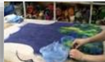
Оборудование для студии валяния