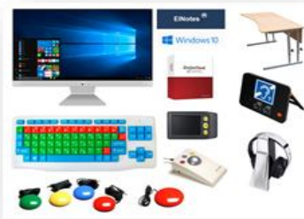
Специализированное оборудование для обучающихся детей-инвалидов